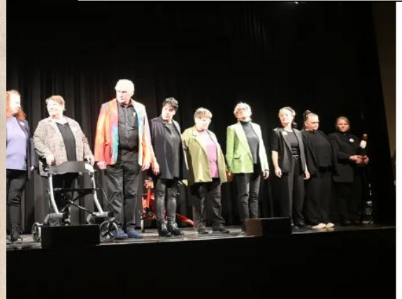
Welt - Meine Welt - Unsere Welt.

Singener Wochenblatt online vom 2.12.2025