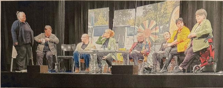
In einer etwas längeren Szene des Inszenenstücks „Deine Welt, Meine Welt, Unsere Welt“ wird auch der „Montagsbus“ des Projekts Redezeit der Singener Tafel vorgestellt. Der Bus dient von Mai bis Oktober regelmäßig auf dem Parkplatz am Berliner Platz und bietet einen Raum für Gespräche.