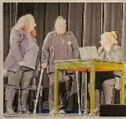
Armut hat auch beim Arztbesuch Konsequenzen. Eine Szene mit der Arztheilerin.

Dass trotz schwieriger persönlicher Umstände die Lebensfreude und der Humor nicht verloren gehen dürfen, machten die Laienschauspieler in einer der ersten Szenen der Aufführung deutlich: Den Unterschied, ob man als Kassen- oder als Privatpatient beim